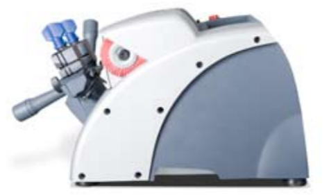
Depth 420 mm. Profundidad