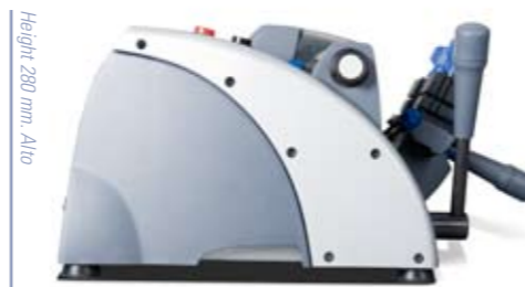
Height 280 mm. Alto

Safety: Start switch on the back. Slide release button for key cutting. Automatic stop removal system. Ample cutter protection. Brush area protection. Swarf collection tray.